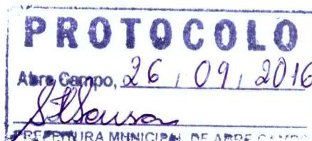
Márcio Moreira Vítor Prefeito Municipal